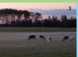
1 Gesund und kräftig: Salzwiesenrind aus der Rasse Limousin | 2 Naturschutz und Genuss in einem: Lüneburger Heidschnucke | 3 Traumhaft schön: der Nationalpark Vorpommersche Boddenlandschaft | 4 Ein Festagsessen: Rinderragout vom Salzwieserind | 5 Reiner Munz zu Besuch bei Mathias Schilling.